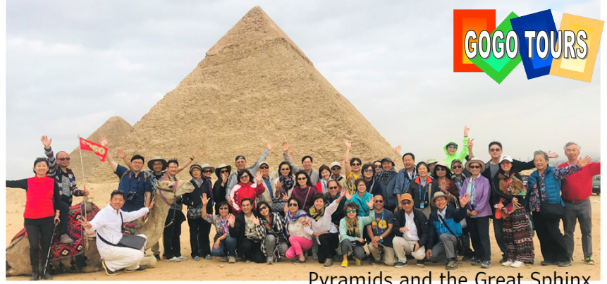
Pyramids and the Great Sphinx