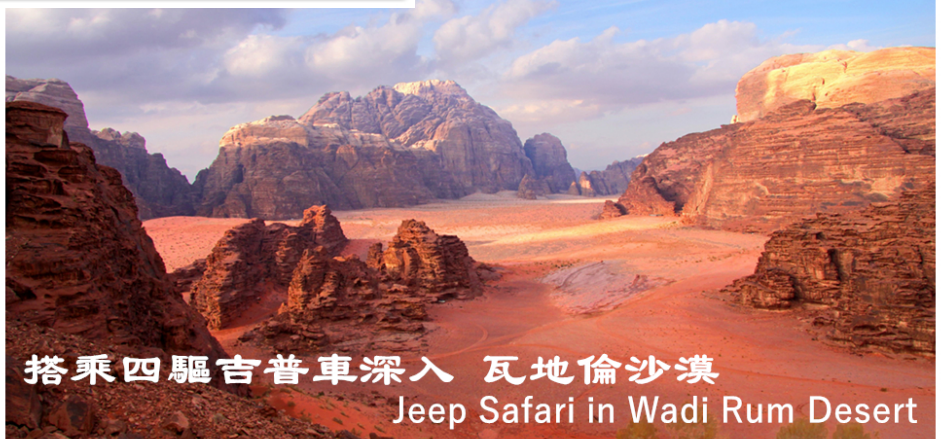
搭乘四驅吉普車深入 瓦地倫沙漠 Jeep Safari in Wadi Rum Desert

金字塔和獅身人面像 開羅博物館 帝皇谷 女皇神殿 樂蜀神廟 卡納神廟 阿斯旺 大水壩 未完工方尖碑 古代帆船 阿布辛貝神廟 金安寶神廟 艾德夫神廟 開羅大市集 古埃及紙莎草畫和香精廠