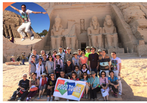
Abu Simbel Temples 亞貝辛布神廟

耶路撒冷 耶穌十四苦路 哭牆 橄欖山 客西馬尼園 萬國教堂 大衛城 主誕堂 聖墓教堂 馬槽 五餅二魚堂 約旦河耶穌洗禮地 耶穌最後晚餐 以色列博物館及死海古卷 海法 巴海大同聖殿及花園