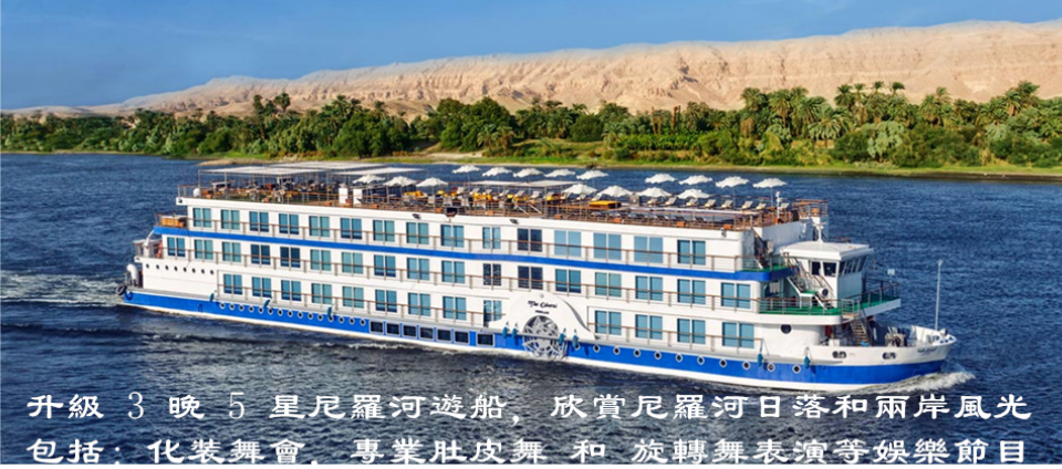
升級 3 晚 5 星尼羅河遊船, 欣賞尼羅河日落和兩岸風光 包括: 化裝舞會, 專業肚皮舞 和 旋轉舞表演等娛樂節目